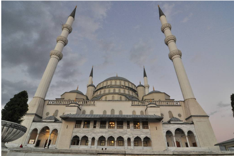
Fotó: dr. Németh Zoltán