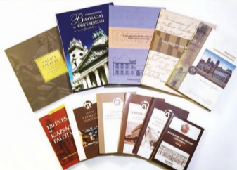
Válogatás a közzelt bírósgágtörténeti kiadványokból.