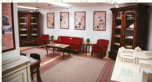
A Debreceni Járásbíróság bíróságtörténeti kiállításának részlete.