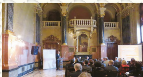
„A magyar bírósági szervezet története” címmel 2016. december 15-én, a 120 éves Igazságügyi Palotában rendezett konferencia megnyitása. (CBBH HÍR)