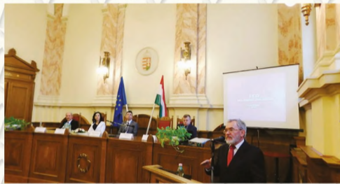
„A Gyulai Törvényszék Novák Kamillóidejében” címmel rendezett konferencia és kiállítás megnyitása a Gyulai Törvényszékben 2017. február 24-én.

A 10 roll upot és számos tárgyi emléket, dokumentumot, valamint bíróságtörténeti kötetet felvonultató kiállításra sok tárgy a Berettyóújfalusi Járásbíróság és a Debreceni Járásbíróság gyűjteményéből érkezett. A kiállítás a jogi egyetemek (ELTE, KRE, SZE, DE) jogtörténeti tanszékei, az Országos Bírósági Hivatal Magyar Igazságügyi Akadémia, a Debreceni Törvényszék, a Kúria Tőry Gusztáv Szakkönyvtára, valamint a Fővárosi Törvényszék Könyvtára együttműködésével valósult meg.