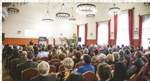
„A jogszolgáltatás története Berettyóújfaluán” címmel rendezett konferencia és bíróságtörténeti kiállítás megnyitása a berettyóújfalusi egykori megyeháza dísztermében 2017. január 23-án.