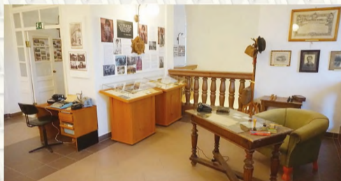
A Berettyóújfalusi Járásbíróság bíróságtörténeti kiállításának részlete.