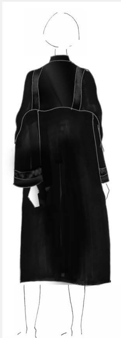
“B” KÚRIA (GOMBOK ÁTHELYEZVE)