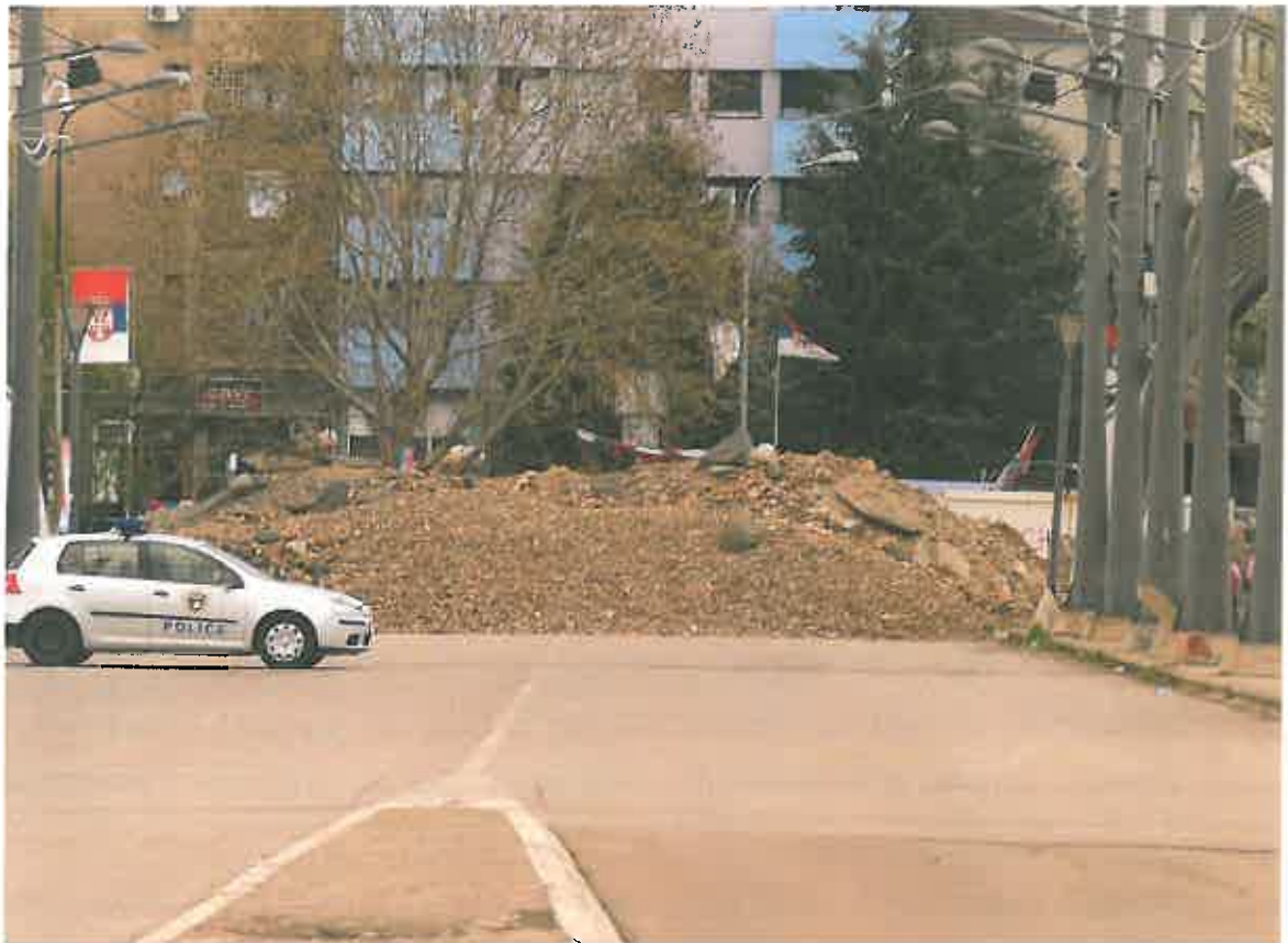
Mitrovica – anet e lumit Iber, veri dhe jug